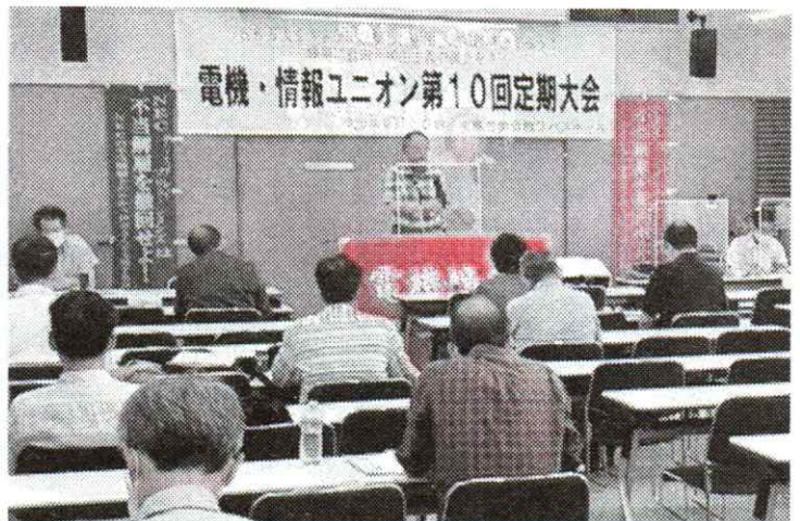
2020年9月18日(日)第10回定期大会

電機情報関連産業の中での労働組合運動が確実に経験を積み、労働者の要求実現に本格的な大企業との活動と運動が「闘いの砦の役割」を發揮できるまでになったことを改めて考える新年となりました。 そして、これまで経験したことがないコロナ禍のもとで、電機・情報ユニオンの存在を多くの電機情報関連産業で働く労働者に知らせていきたいとの思いを強くしました。